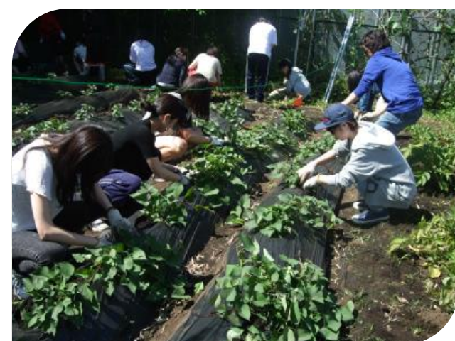
地下茎を傷つけないように・・・ 丁寧に草取りをしました。