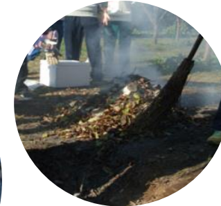
じっくり蒸し焼きにして・・・ 美味しくなりますように。