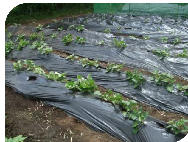
あっ！葉っぱが成長してきた！！