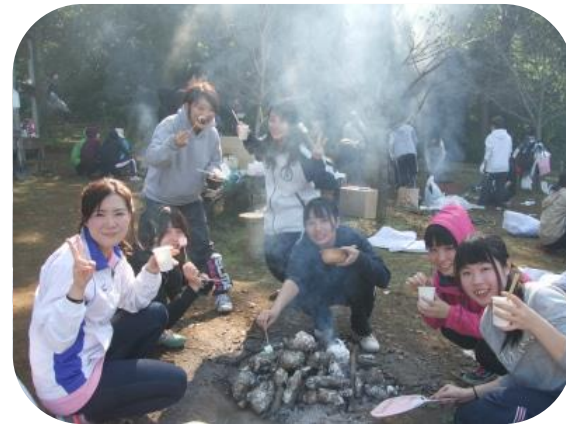
紙コップの中身はなあに？ 豚汁かな？？