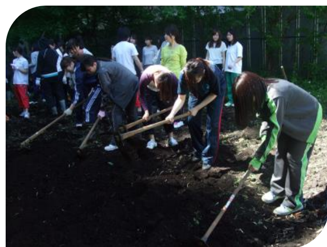
慣れない鍬を持って頑張りました。 よいしょ よいしょ！