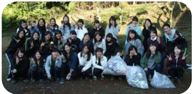
計画性抜群でした“ Dグループ”