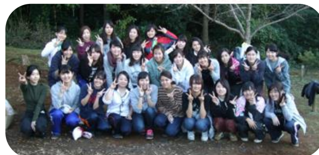
最後の追い上げが素晴らしかった“ Aグループ” 優しさ溢れるチームワーク“ Cグループ”