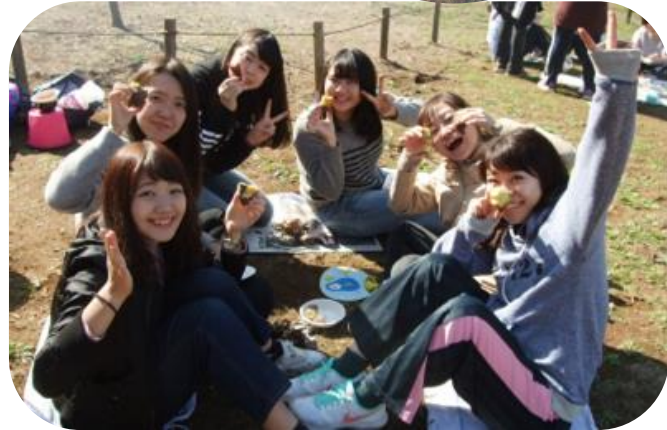
見て見て～～！！美味しくできたよ！

同じ目標を持って過ごす事って素敵。 「さつまいも」を通して生まれた笑顔。 一人ひとりの表情が充実感で満ち溢れていました。