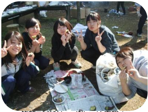
笑顔で「美味しい・楽しい」を表現！