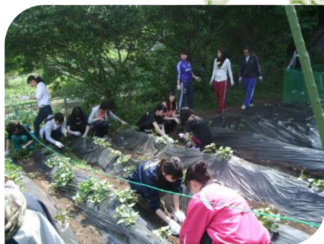
暑い日の草取りも頑張りました！

1年生が、 畑を耕して ビニールを貼り 苗を植え 草を取り 美味しさの秘訣、“ツル返し”もして、