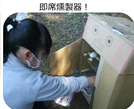
即席燻製器！ チーズにベーコン、卵など・・・美味しくできました！