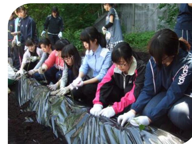
ビニールシートに穴をあけて、苗を植えました。 みんな真剣です。