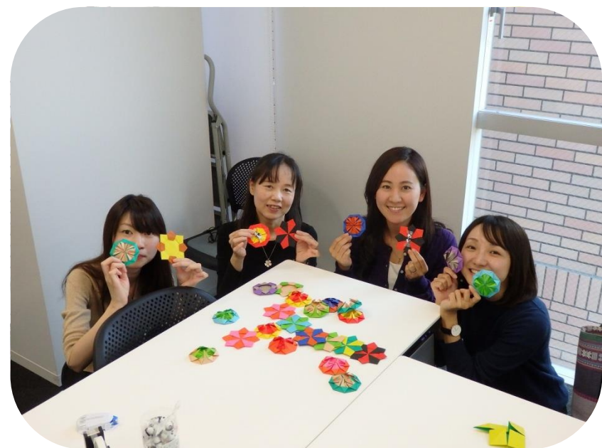
先生たちもまごころ込めて、メダルをつくりました。