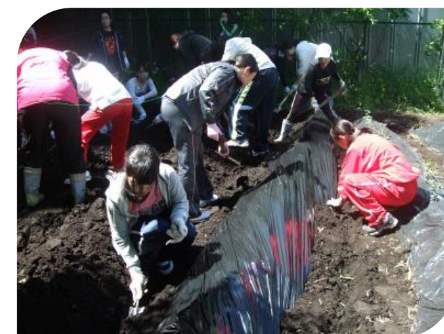
ビニールシートの端を、しっかり土に埋めています。