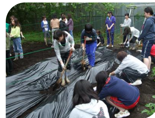
黒いビニールシートをかぶせたよ。 湿度維持、雑草の抑制等メリットがあるんだよね！