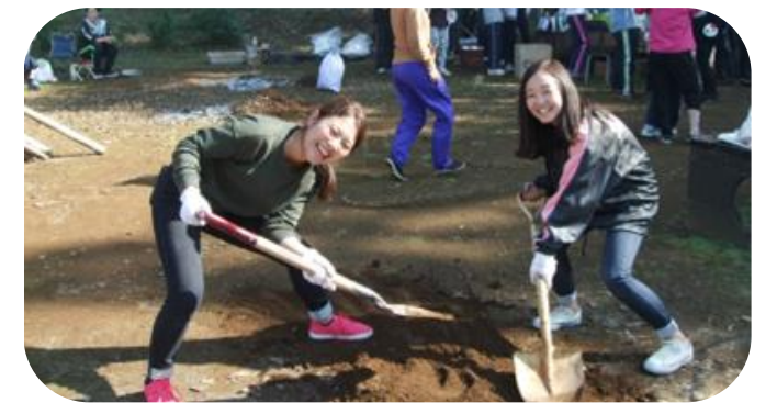
友達とすれば、何をしても楽しいんだね☆ 大切なこと。