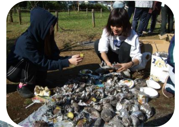
中まで焼けているかな？ ひとつひとつ丁寧に確認！