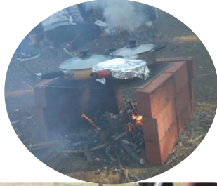
何が出来るのかな？