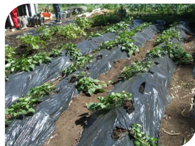
ツルがぐんぐん伸びてきたよ。 太陽の光を沢山浴びているね！