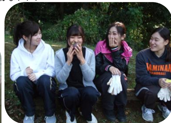
味見してみよう。 大切なお芋、皆で分け合っこ。