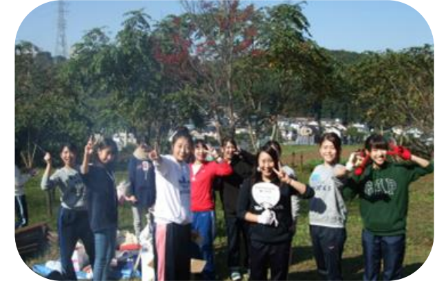
外で過ごすのに 絶好のお天気でした。 皆の笑顔が眩しいな。