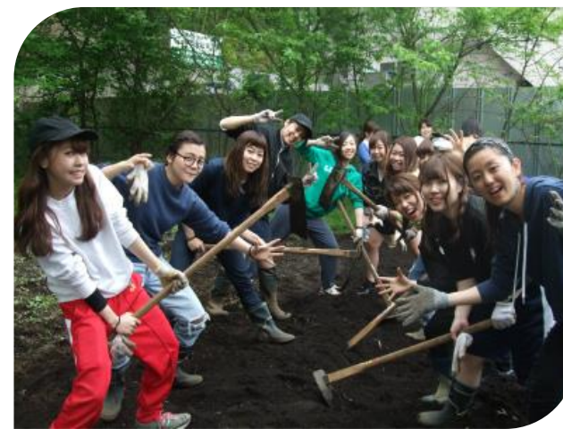
耕すって楽しいな。鍬から伝わる土の感触はどうだったかな？