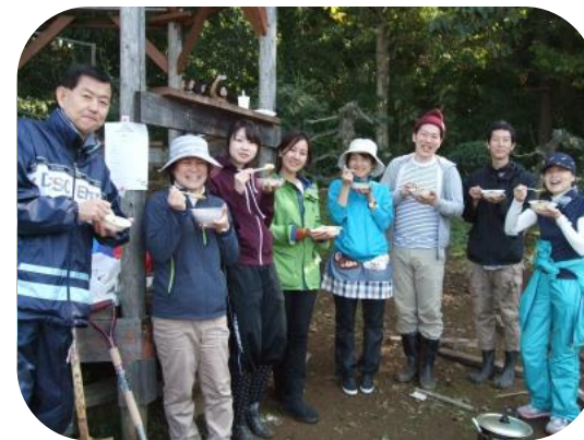
先生達も楽しみました！ ちよっぴりイタズラ心も加えてへへ