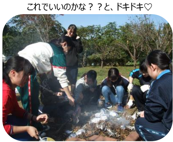
これでいいのかな？と、ドキドキ♡