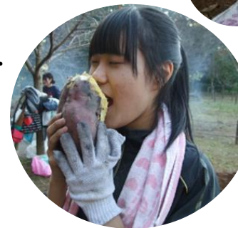
大きなお芋！ お味はいかが？？