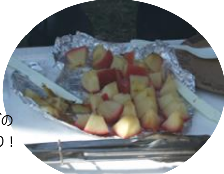
焼きリンゴの 出来上がり！