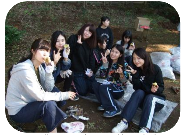
皆で作って皆で食べるって嬉しい事だね！