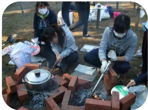
効率良く火を維持させるにはどうしたら 良いのかな？