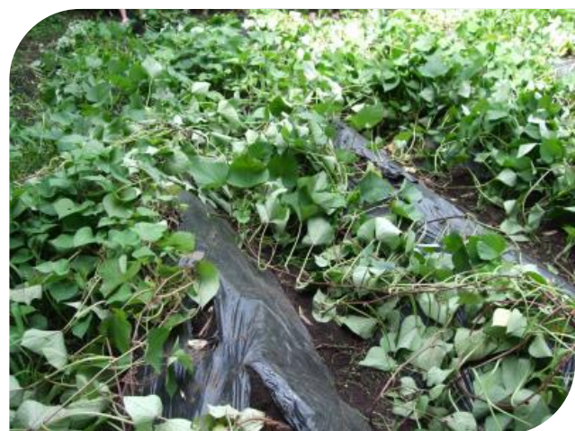
わ～～！！元気いっぱい育っているね。 甘くて美味しいお芋になあれ。 ぐんぐん ぐんぐん大きくなあれ！