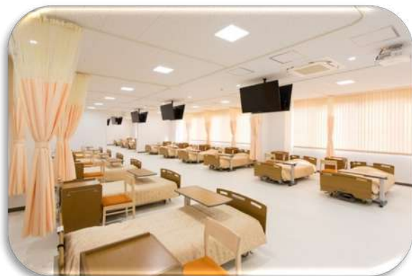
看護学部実習館「実習室」にて開催します