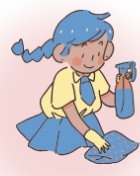
ドアノブやスイッチの 消毒

保健委員さんだけでなく、KOMAJO生みんなが感染症対策を行っていきましょう!協力よろしくお願いします♪