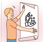
各クラスに ポスターの掲示

感染症対策について保健委員会を行いました。保健委員さんをお願いした仕事は、この5つです。