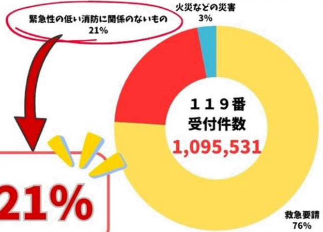
災害別119番受付件数の割合(令和6年)

緊急性のない・消防に関係のない問い合わせ (例)今やっている病院を教えてください。 症状の相談がしたい。 電気が消えなくなった。なんとかしてほしい。