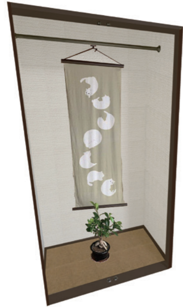
A 案 ... 床の間のような空間