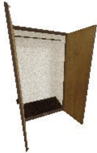
B 案 ... 収納としての役割をもつ空間