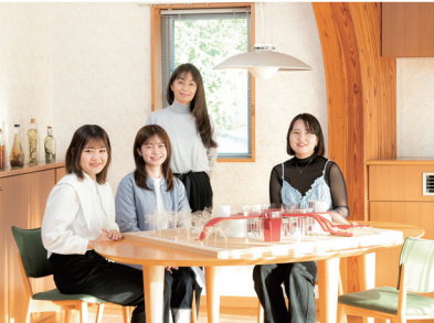
空間デザイン学部 空間デザイン学科(仮称)*