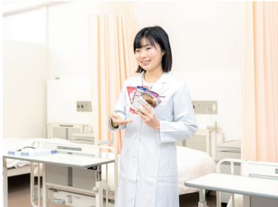
人間健康学部 健康栄養学科