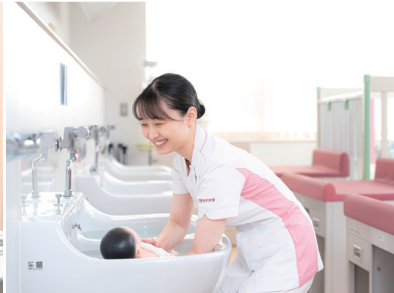
看護学部 健康学科