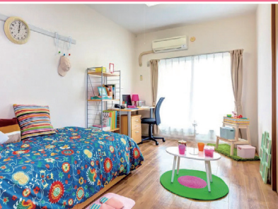
専用学生寮(ラポール百合ヶ丘)