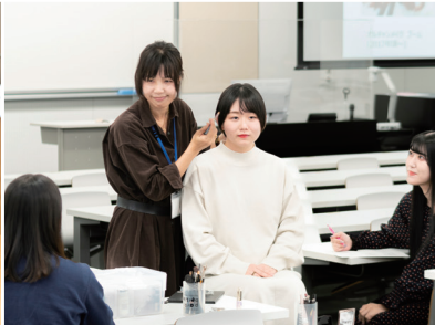
共創文化学部 人間関係学科(仮称)*