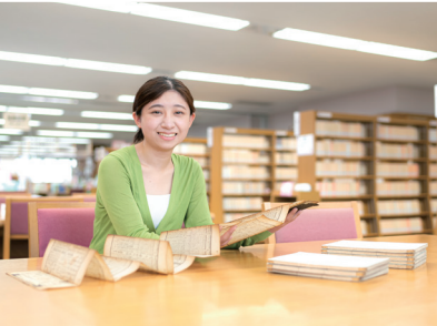
共創文化学部 国際日本学科(仮称)*