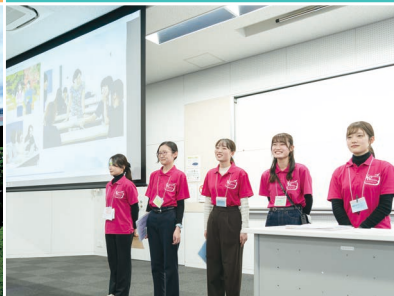
オープンキャンパス学生スタッフ