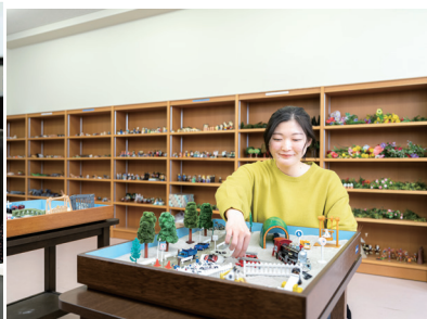
共創文化学部 心理学科(仮称)*