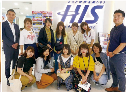
観光文化学部 観光文化学科(仮称)*