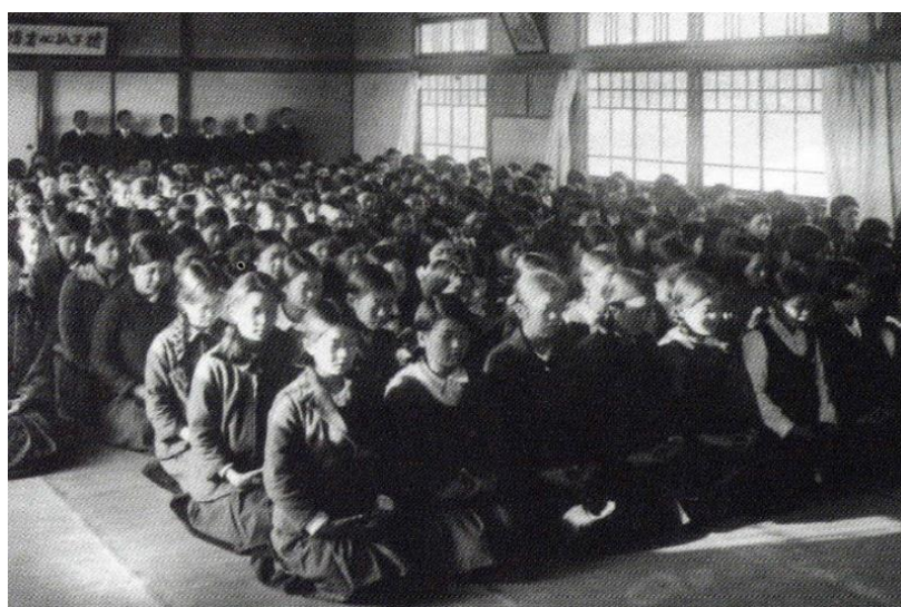
1932年頃 講堂での「正念」

すなわち、「知性」は「行学」の「学」と、「理性」は「行学」の「行」と対応する。学園の各設置校が、建学の精神と教育理念を基に、それぞれの教育目的・教育目標をしっかりと定め、女子総合学園としての一体感を創出することに努める。